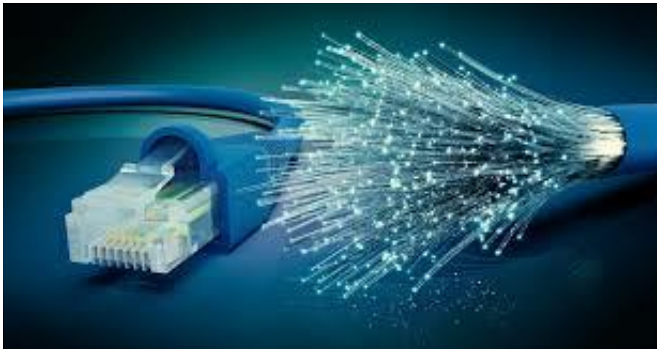
Déploiement de la fibre optique sur Arrancourt